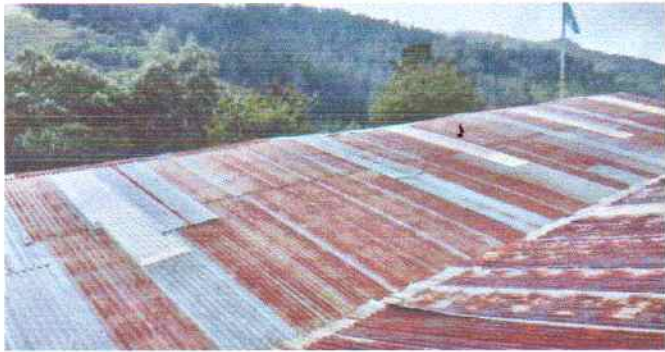
Foto1: Cambio de Techo por Lamina Troqueola Aluzinc Calibre 26